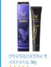
クラマラスバクブライモ イストジェル 30g