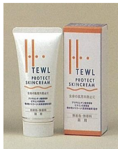
ハイテウル プロテクトスキンクリーム