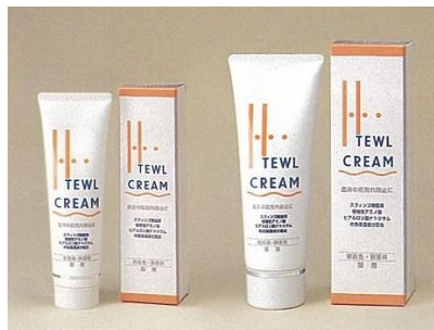
ハイテウル クリームN