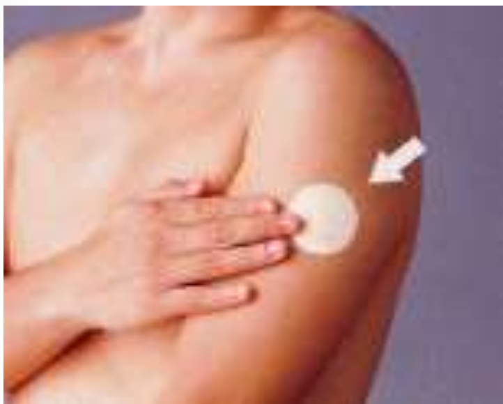
・ニコチンパッチ