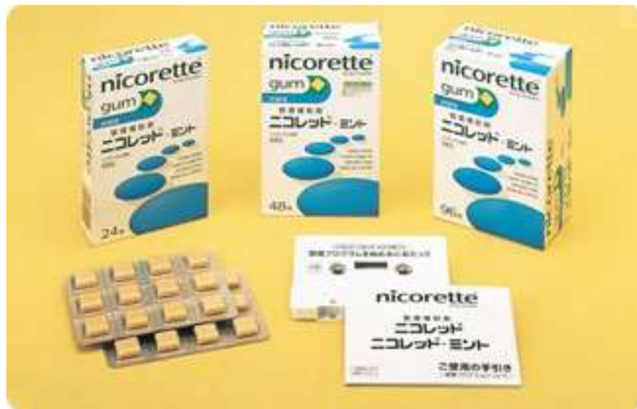
・ニコチンガム（ニコレット）