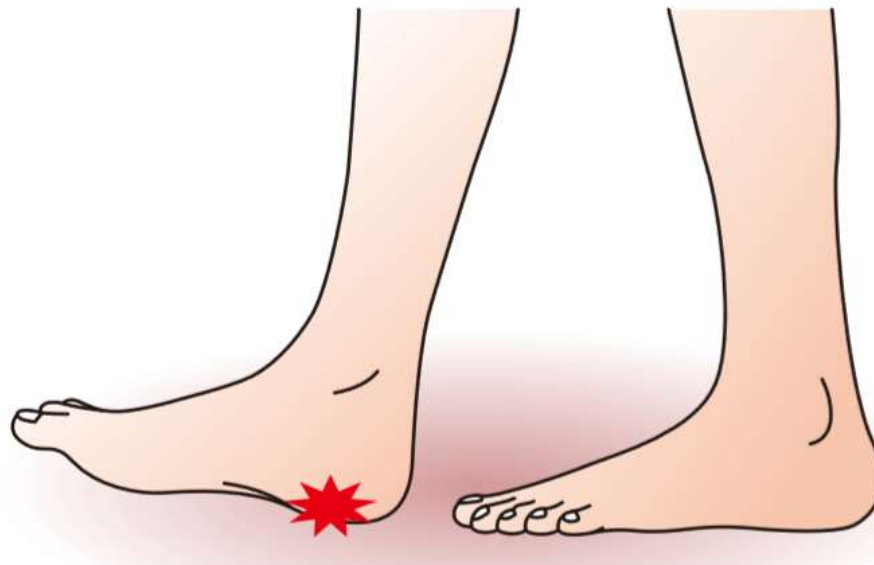
足底腱膜付着部にかかる圧迫力と牽引力