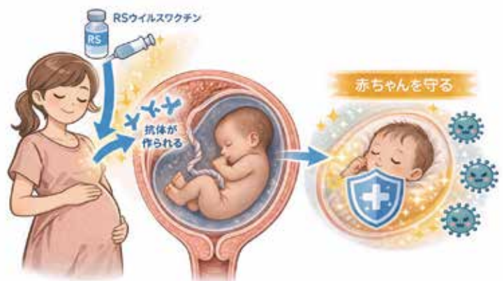
図1：母子免疫のイメージ

が作られ、その抗体が胎盤を通じて赤ちゃんに移行します。これにより、赤ちゃんは産まれた直後からRSウイルスに対する防御力を持つことができます。(図1)